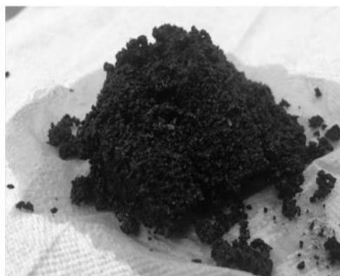
圖 2 咖啡渣