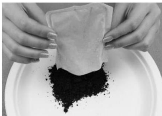
圖 1 市售暖暖包

市售暖暖包(如下圖 1 所示)中常加入蛭石,其功用為跟空氣接觸後,能快速地吸收空氣中水分,加速鐵粉的氧化速率,進而放熱達成暖暖包的效果。 小育 想要以咖啡渣(如下圖 2 所示)來取代暖暖包內容物—蛭石,以期減少廢棄量。因此進行以下兩組實驗: